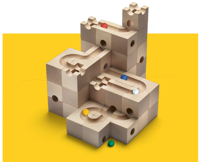
Le système des circuits à billes CUBORO : le Starter Set STANDARD 50

Le système des circuits à billes se compose de plus de 100 éléments CUBORO avec différentes fonctions. En les combinant de manière créative et logique, il est possible de créer une infinité de circuits à billes. CUBORO stimule les enfants et les adultes en fonction de leurs capacités, éveille le plaisir d'expérimenter et soutient la pensée logique. Le système des circuits à billes entraîne la motricité fine, renforce la représentation spatiale et stimule la créativité. CUBORO peut être joué seul ou en groupe pour favoriser la collaboration – à la maison, dans les jardins d'enfants, les écoles et les équipes.