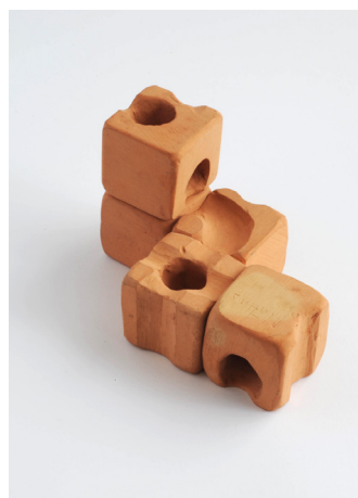
Le premier prototype CUBORO en argile en 1976

CUBORO est fabriqué en Suisse à partir de bois naturel. La menuiserie Nyfeler Holzwaren SA dans le canton de Berne transforme du bois de hêtre régional de la plus haute qualité en éléments CUBORO. Du séchage du bois à la fabrication de l'emballage, toutes les étapes de la production ont lieu en Suisse, en collaboration avec des partenaires de longue date. La grande qualité du produit est une garantie de plaisir à vie.