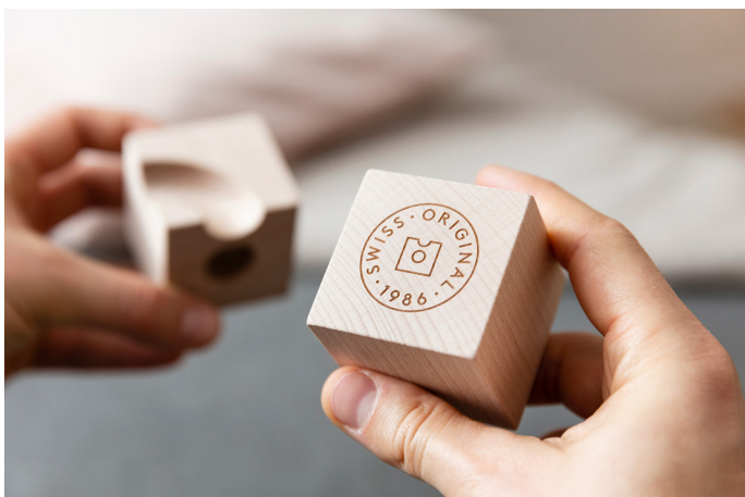
Éléments originaux CUBORO en bois de hêtre suisse