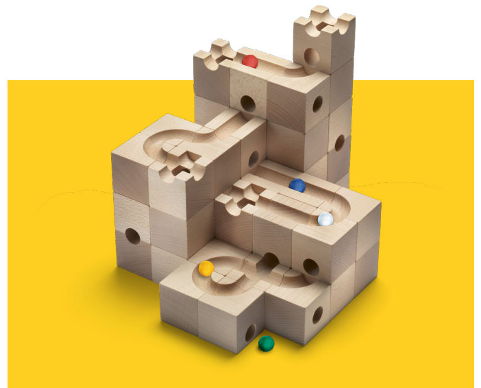
Das CUBORO Kugelbahnsystem: das Starter Set STANDARD 50