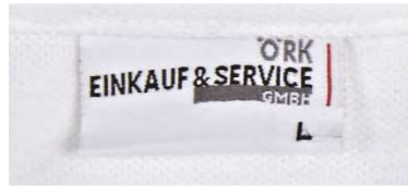
Étiquette cousue, standard