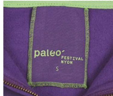
Étiquette cousue avec couture "Bourdon".