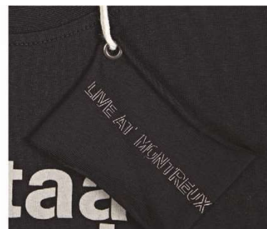
Hang tag en coton