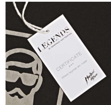
Hang tag en carton