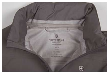
impression dans le col