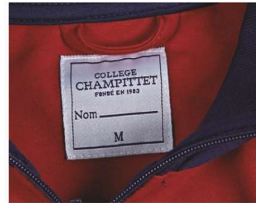
Étiquette tissée avec coutures sur 4 côtés