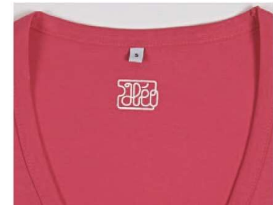
transfert dans le col