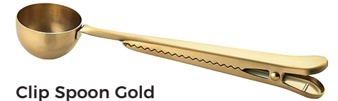
Clip Spoon Gold Art. Nr. 77360179