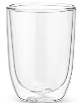
300 ml Art. Nr. 77360177