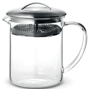
0.4 l Art. Nr. 77360096

La préparation parfaite : mettre 2 cuillères (Clip Spoon) dans le Tea Maker, puis remplir le Tea Maker d'eau chaude et mettre le couvercle. Laisser infuser le thé et voilà – une tasse de thé parfaite est prête !