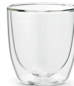
200 ml Art. Nr. 77360176