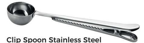
Clip Spoon Stainless Steel Art. Nr. 77360178