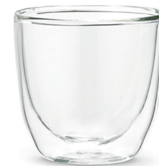
100 ml Art. Nr. 77360175

Nous voulons vous offrir tout ce dont vous avez besoin pour une tasse de thé parfaite ! C'est pourquoi nous avons développé un verre à thé qui résout précisément ce problème – notre 'Double Wall Glass Cup' !