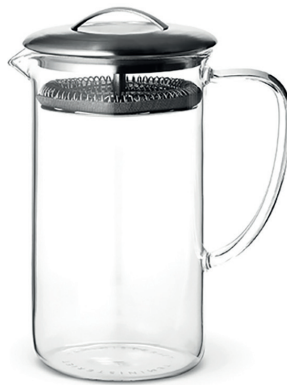
0.6 l Art. Nr. 77360173