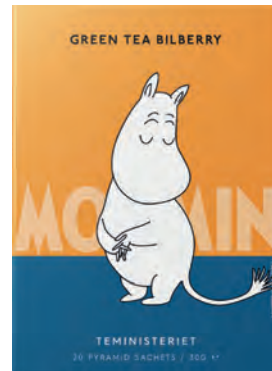
GREEN TEA BILBERRY