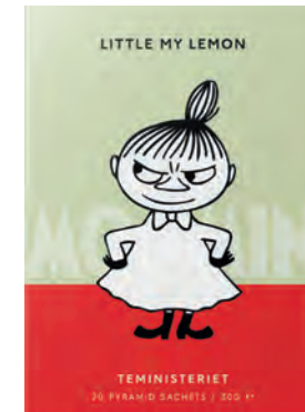
LITTLE MY LEMON