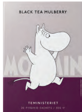
BLACK TEA MULBERRY