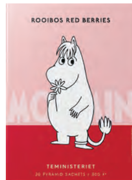
ROOIBOS RED BERRIES