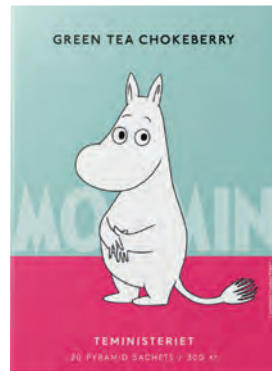
GREEN TEA CHOKEBERRY