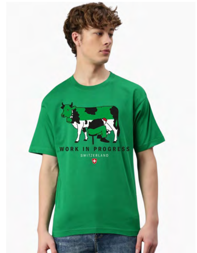
2088-31 Work in Progress S – 3XL

Herren T-Shirt mit Rundhals. Nackenband, Doppelnaht an Arm und Bund, mit Seitennaht. Vorgeschrumpft.