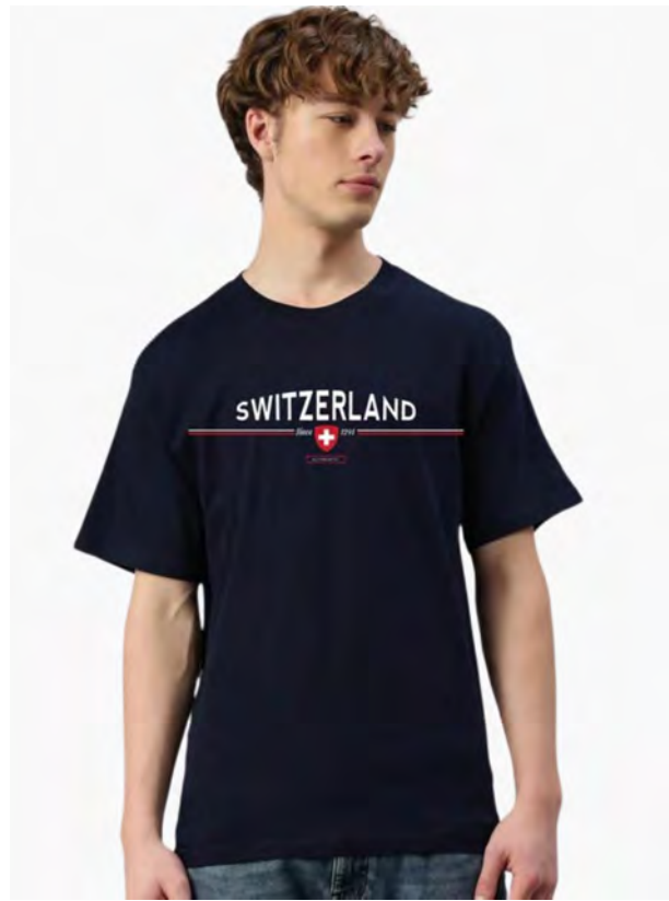
2037-20 Since 1291 S – 3XL

Unisex T-Shirt mit Rundhals. Nackenband, Doppelnaht an Arm und Bund, mit Seitennaht. Vorgeschumpft.