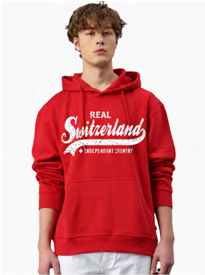
1446-10 Real Switzerland – Hoodie Farbe 10 Rouge S – 3XL