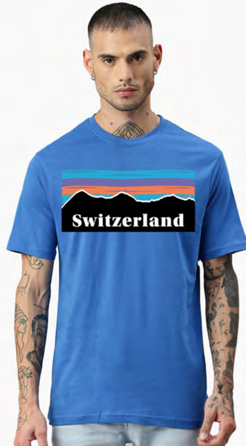
2033-286 Wild Life Switzerland S – 3XL

Herren T-Shirt Rundhals. Nackenband, Doppelnaht an Arm und Bund, mit Seitennaht. Vorgeschumpft.