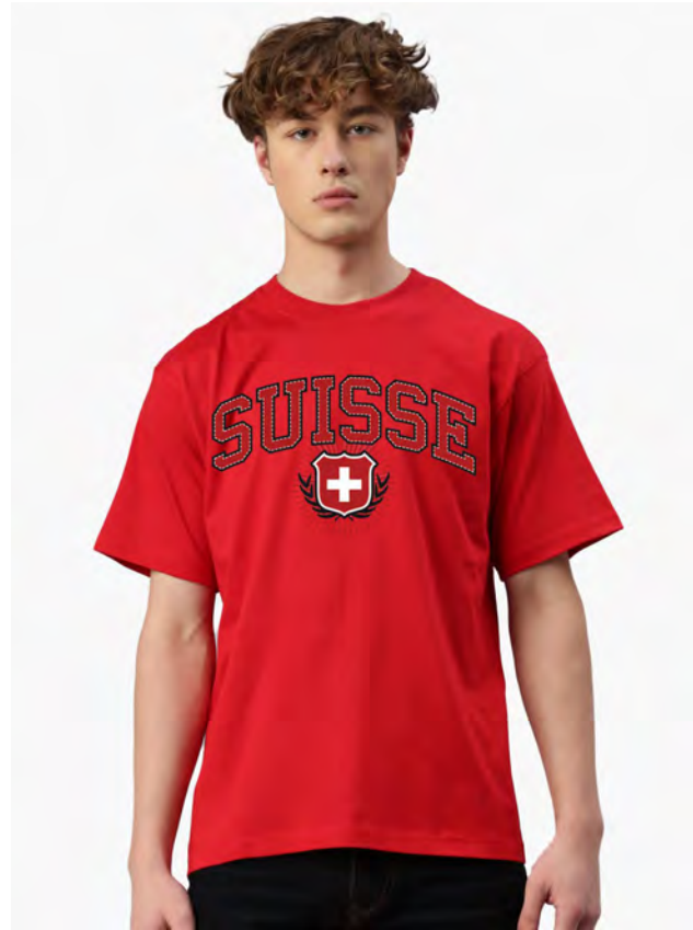
2077-10 SUISSE S – 3XL

Herren T-Shirt mit Rundhals. Nackenband, Doppelnaht an Arm und Bund, mit Seitennaht. Vorgeschrumpt.