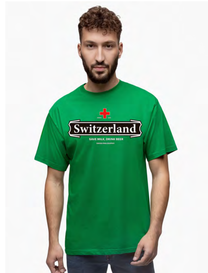
2026-31 Switzerland Beer S-3XL

Unisex T-Shirt mit Rundhals. Nackenband, Doppelnaht an Arm und Bund, mit Seitennaht. Vorgeschrumpt.