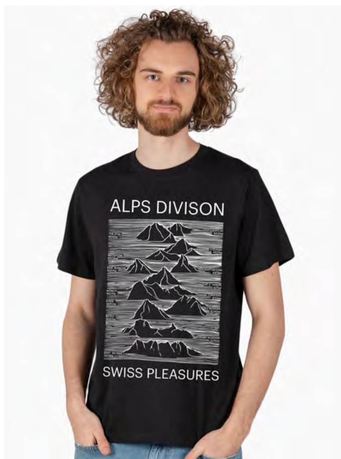
2083-40 Alps Divison S – 3XL

Unisex T-Shirt mit Rundhals. Nackenband, Doppelnaht an Arm und Bund, mit Seitennaht. Vorgeschrumpft.