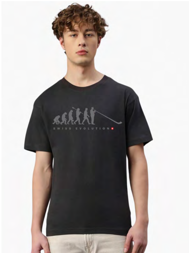
2048-410 Swiss Evolution S – 3XL

Herren T-Shirt mit Rundhals. Nackenband, Doppelnaht an Arm und Bund, mit Seitennaht. Vorgeschrumpft.