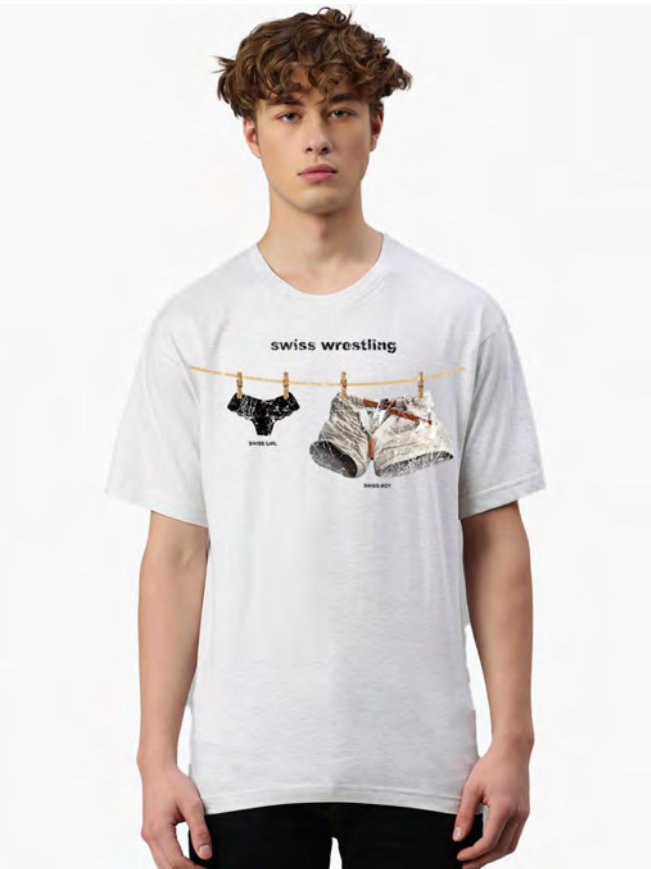
2093-43 Wrestling S – 3XL

Herren T-Shirt mit Rundhals. Nackenband, Doppelnaht an Arm und Bund, mit Seitennaht. Vorgeschrumpt.