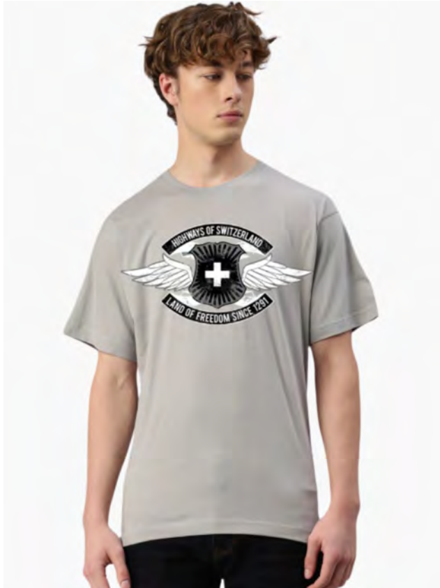
2043-402 Highways of Switzerland S – 3XL

Unisex T-Shirt mit Rundhals. Nackenband, Doppelnaht an Arm und Bund, mit Seitennaht. Vorgeschrumpft.