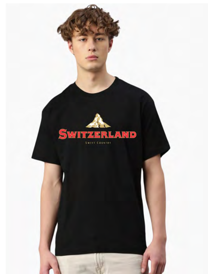
2084-40 Switzerland Mountain S – 3XL

Herren T-Shirt mit Rundhals. Nackenband, Doppelnaht an Arm und Bund, mit Seitennaht. Vorgeschrumpft.