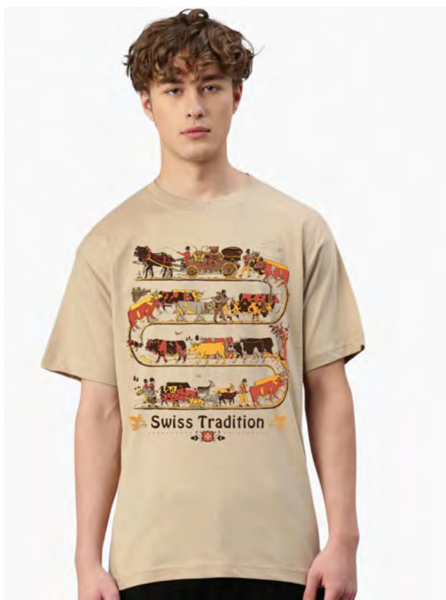
2041-655 Swiss Tradition S – 3XL

Unisex T-Shirt mit Rundhals. Nackenband, Doppelnaht an Arm und Bund, mit Seitennaht. Vorgeschrumpft.