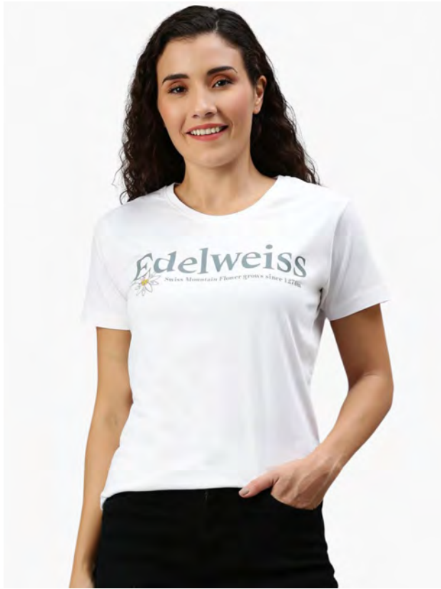
2085 - 1 Edelweiss S – 3XL

Damen T-Shirt mit Rundhals. Nackenband, Doppelnaht an Arm und Bund, mit Seitennaht. Vorgeschumpft.