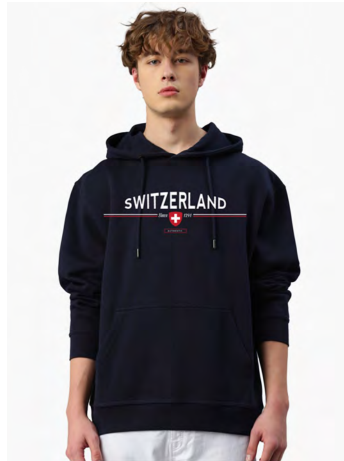
1447-20 Since 1291 Farbe 20 Marine S – 3XL