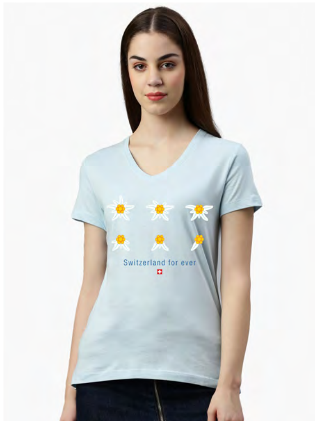
2998-204 For ever S – XXL

Herren T-Shirt Rundhals. Nackenband, Doppelnaht an Arm und Bund, mit Seitennaht. Vorgeschrumpt.