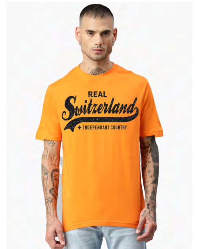
2032-506 Real Switzerland S – 3XL

Unisex T-Shirt mit Rundhals. Nackenband, Doppelnaht an Arm und Bund, mit Seitennaht. Vorgeschrumpt.