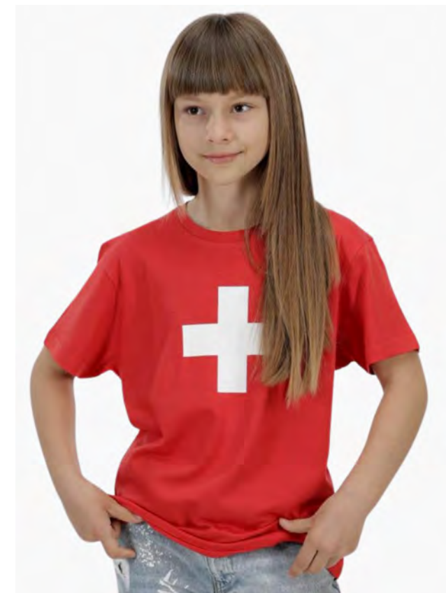
2098 Kids Helvetica 2 – 14

Kinder T-Shirt Rundhals. Nackenband, Doppelnaht an Arm und Bund, mit Seitennaht. Vorgeschrumpft.