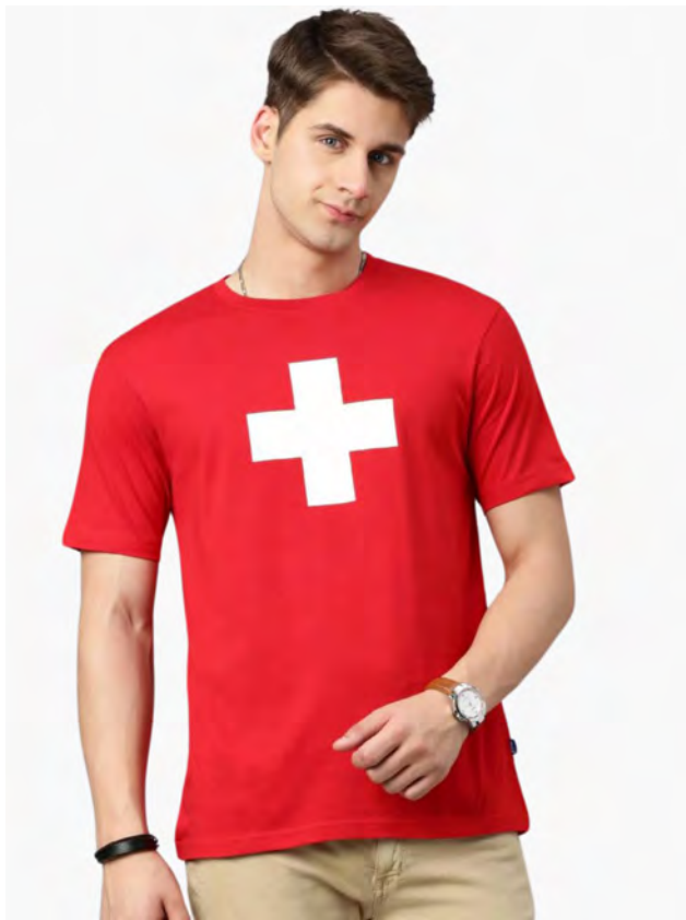
2036-10 Men Helvetica S – 4XL

Herren T-Shirt Rundhals. Nackenband, Doppelnaht an Arm und Bund, mit Seitennaht. Vorgeschrumpt.