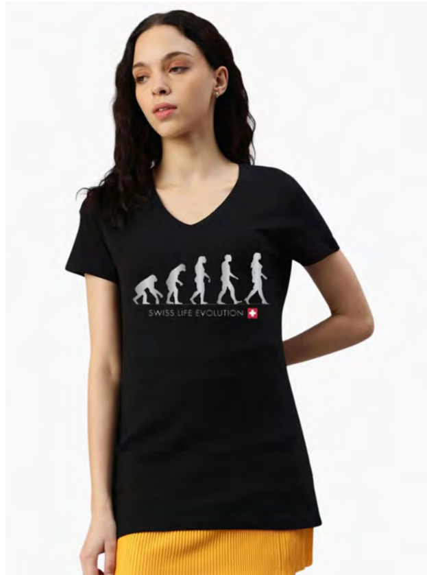
2038 -40 Swiss Life Evolution S – 3XL

Damen T-Shirt mit Rundhals. Nackenband, Doppelnaht an Arm und Bund, mit Seitennaht. Vorgeschumpft.