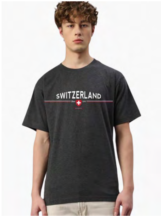
2037-41 Since 1291 S – 3XL

Unisex T-Shirt mit Rundhals. Nackenband, Doppelnaht an Arm und Bund, mit Seitennaht. Vorgeschumpft.