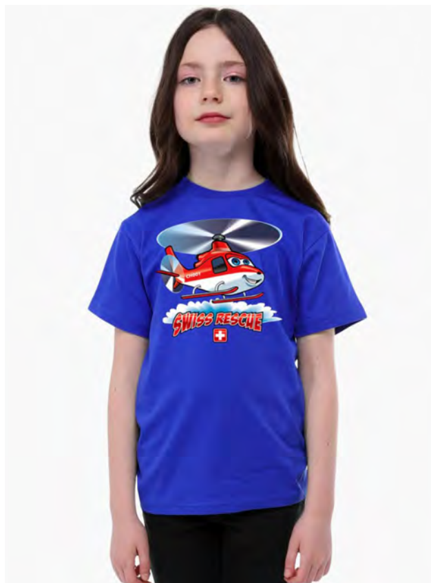
2097-259 Swiss Rescue 4-10

Kinder T-Shirt mit Rundhals. Nackenband, Doppelnaht an Arm und Bund, mit Seitennaht. Vorgeschrumpft.