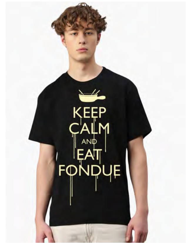
2086-40 Keep Calm and eat Fondue S – 3XL

Herren T-Shirt mit Rundhals. Nackenband, Doppelnaht an Arm - Vorgeschumpft.