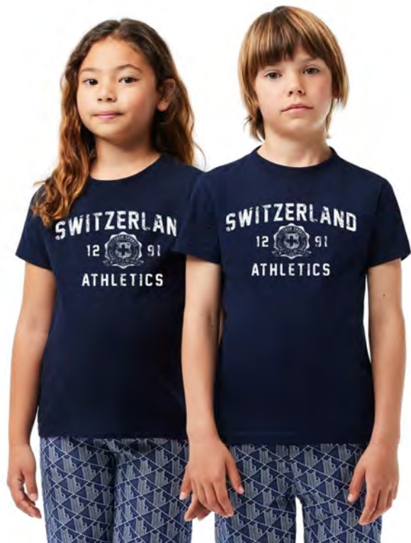
2096 Athletics 4-12

Kinder T-Shirt mit Rundhals. Nackenband, Doppelnaht an Arm und Bund, mit Seitennaht. Vorgeschrumpft.