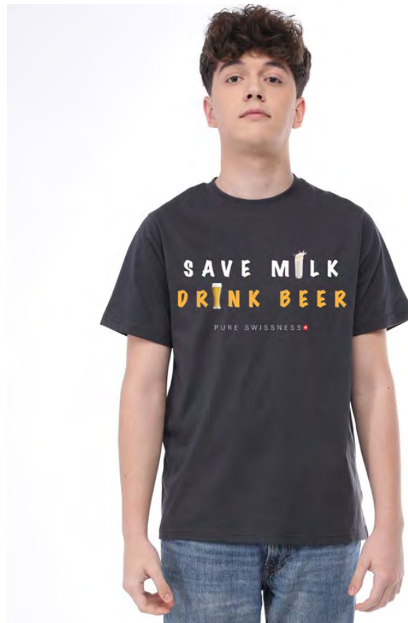
2047-410 Save Milk Drink Beer S – 3XL

Damen T-Shirt mit Rundhals. Nackenband, Doppelnaht an Arm und Bund, mit Seitennaht. Vorgeschrumpft.