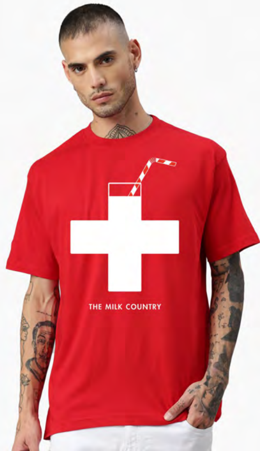
2094-10 Milk Country S – 3XL

Herren T-Shirt Rundhals. Nackenband, Doppelnaht an Arm und Bund, mit Seitennaht. Vorgeschumpft.