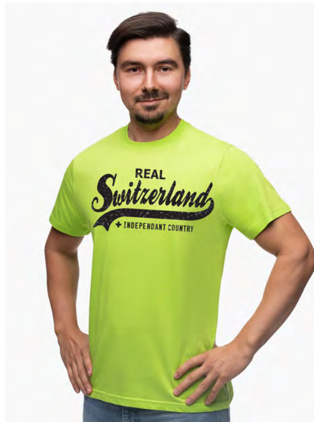
2029-364 Real Switzerland S – 3XL

Herren T-Shirt mit Rundhals. Nackenband, Doppelnaht an Arm und Bund, mit Seitennaht. Vorgeschrumpt.