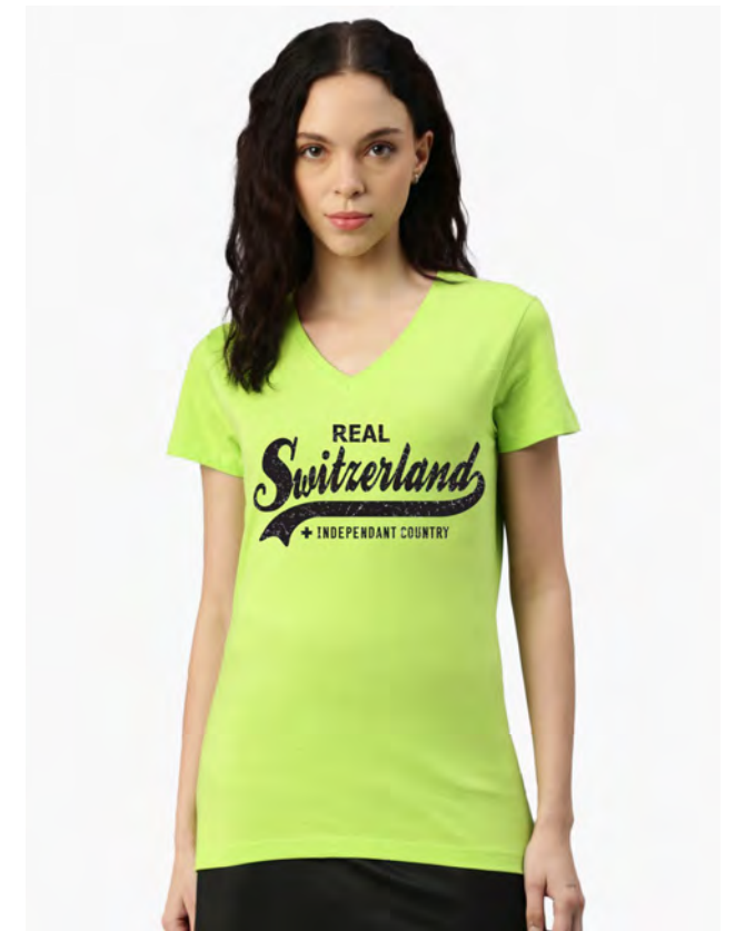
2030-364 Real Switzerland S – XXL

Unisex T-Shirt mit Rundhals. Nackenband, Doppelnaht an Arm und Bund, mit Seitennaht. Vorgeschrumpt.