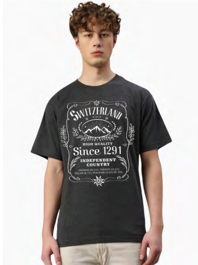
2040-41 Black Swiss S – 3XL

Unisex T-Shirt mit Rundhals. Nackenband, Doppelnaht an Arm und Bund, mit Seitennaht. Vorgeschrumpft.