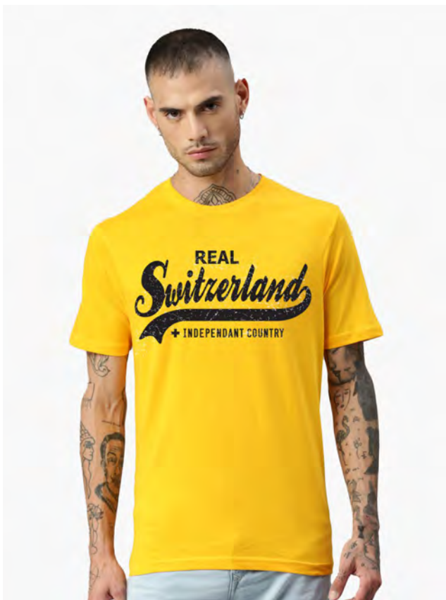
2027-53 Real Switzerland S – 3XL

Herren T-Shirt Rundhals. Nackenband, Doppelnaht an Arm und Bund, mit Seitennaht. Vorgeschrumpt.