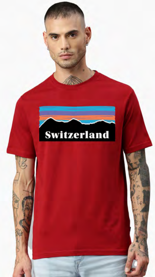
2033- 107 Wild Life Switzerland S – 3XL

Herren T-Shirt mit Rundhals. Nackenband, Doppelnaht an Arm und Bund, mit Seitennaht. Vorgeschumpft.