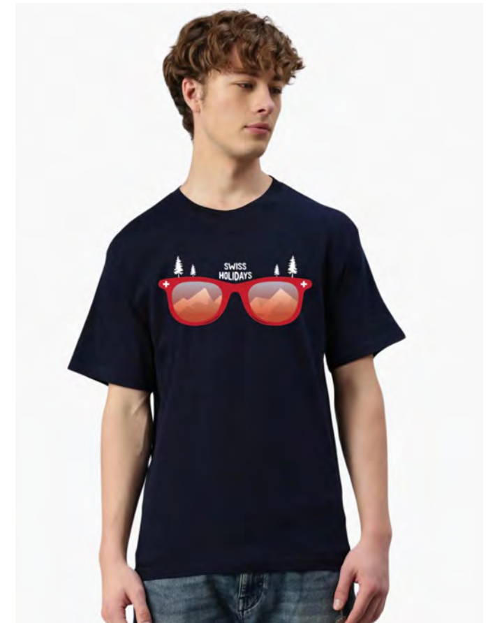
2087-20 Holidays S – 3XL

Unisex T-Shirt mit Rundhals. Nackenband, Doppelnaht an Arm und Bund, mit Seitennaht. Vorgeschrumpft.