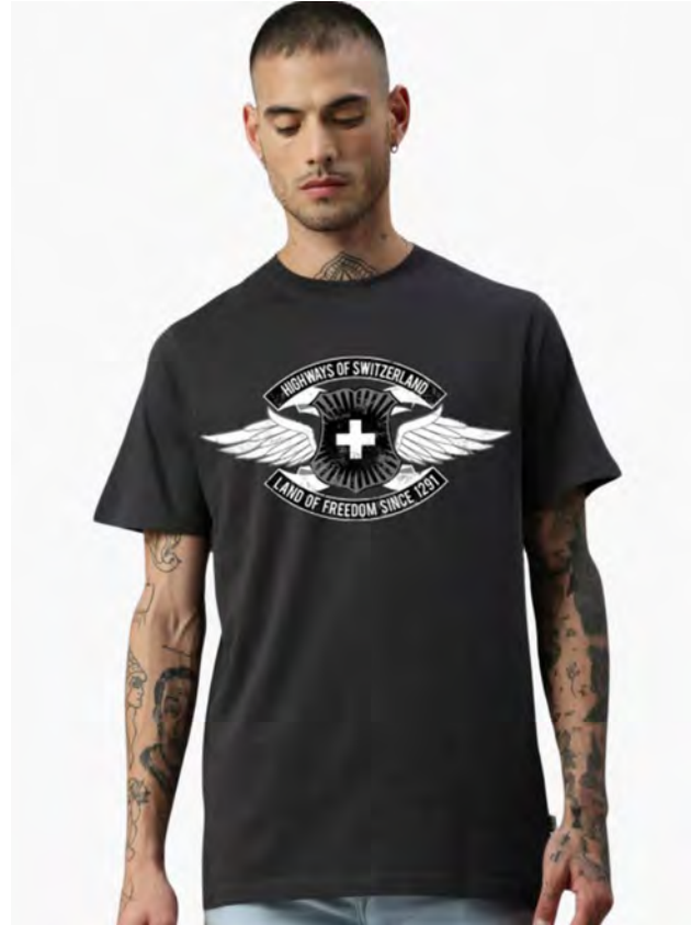
2043-410 Highways of Switzerland S – 3XL

Unisex T-Shirt mit Rundhals. Nackenband, Doppelnaht an Arm und Bund, mit Seitennaht. Vorgeschrumpft.