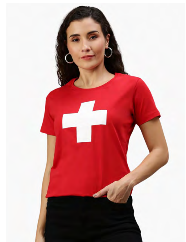
2035 Lady Helvetica S – 3XL

Damen T-Shirt mit Rundhals. Nackenband, Doppelnaht an Arm und Bund, mit Seitennaht. Vorgeschumpft.