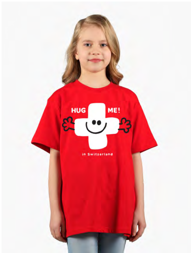
2025-10 Hug Me 4-10

Kinder T-Shirt Rundhals. Nackenband, Doppelnaht an Arm und Bund, mit Seitennaht. Vorgeschrumpft.