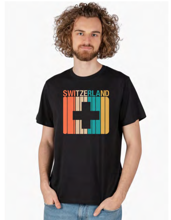
2045-40 Swiss Horizon S-3XL

Unisex T-Shirt mit Rundhals. Nackenband, Doppelnaht an Arm und Bund, mit Seitennaht. Vorgeschrumpt.